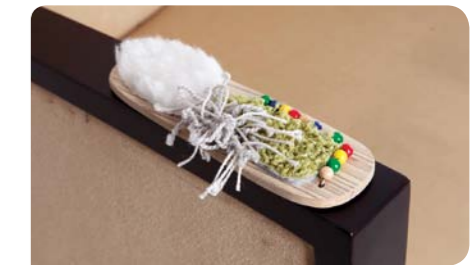
Accoudoir à surface tactile