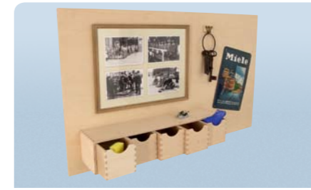
Panneau de souvenirs