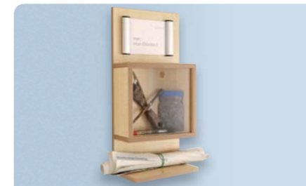
Boîte de réminiscence pour porte