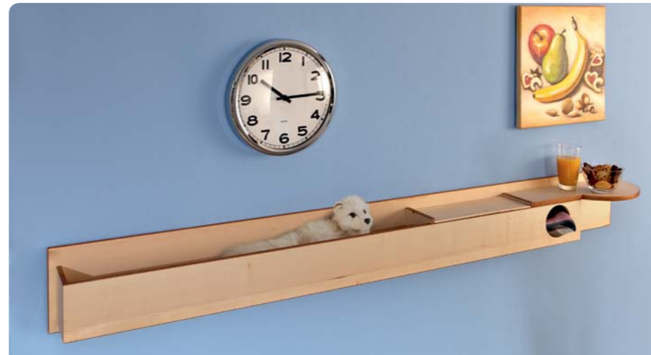
Tableau « Nature morte »