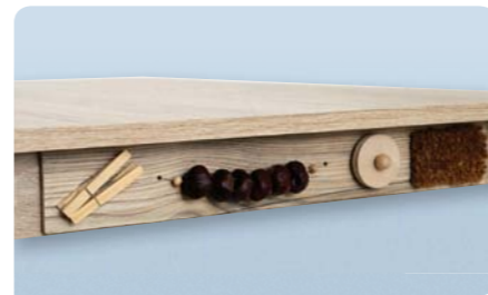
Tablette à surface tactile