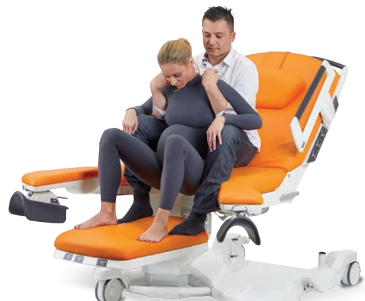
Semi-assise avec l'aide de son partenaire