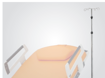
Tige à perfusion