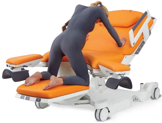
A genoux en appui sur bras