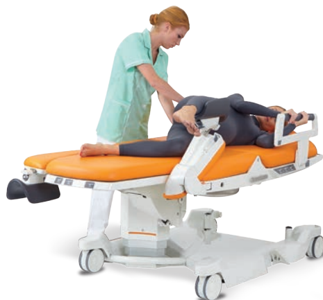
Couchée sur le côté