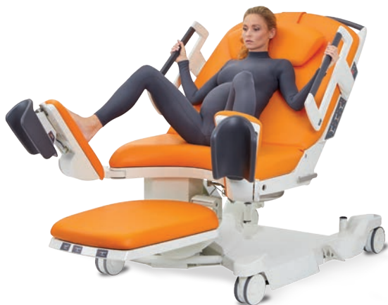
Position gynécologique active avec les pieds sur les repose-jambes