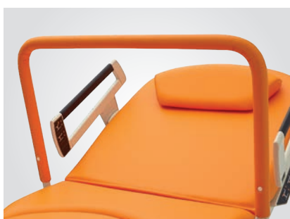
Barre de suspension