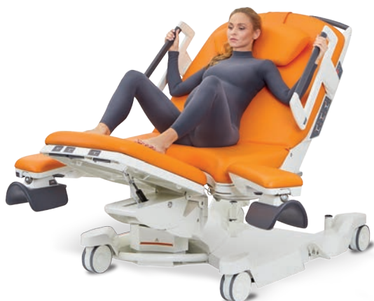
Semi couchée avec les pieds sur la section jambière