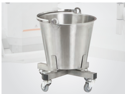
Seau à placenta sur roulettes