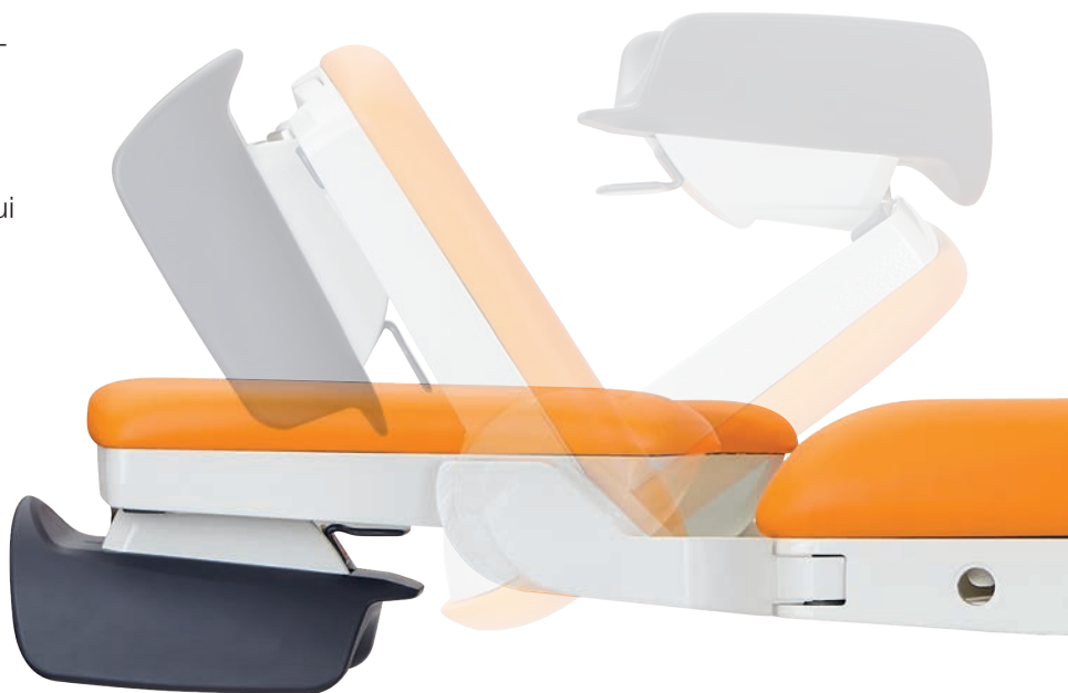
Réglage rapide des repose-jambes.

L'amplitude des axes de positionnement des repose-jambes permet à l'équipe soignante de répondre très rapidement et efficacement aux différentes situations qui peuvent se produire lors de l'accouchement.