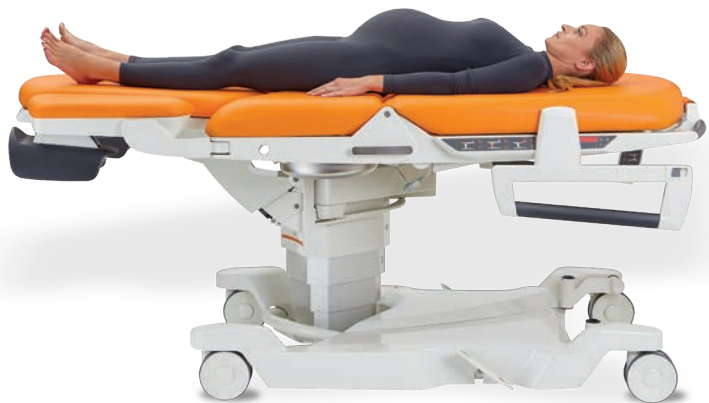
Remise à plat d'urgence du relève buste