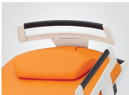
Tête de lit amovible