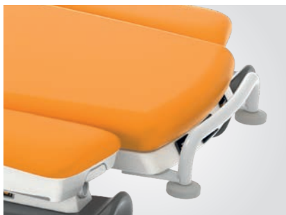
Barre de brancardage