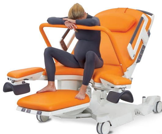
Assise, accoudée à la barre