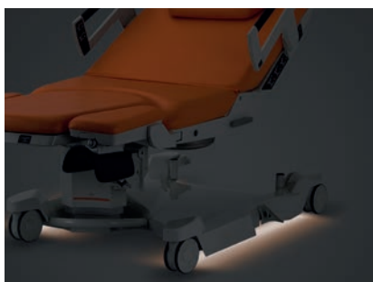
Veilleuse de nuit