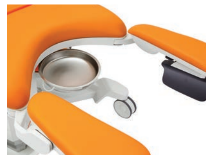
Sliding stainless catch basin 4.5l