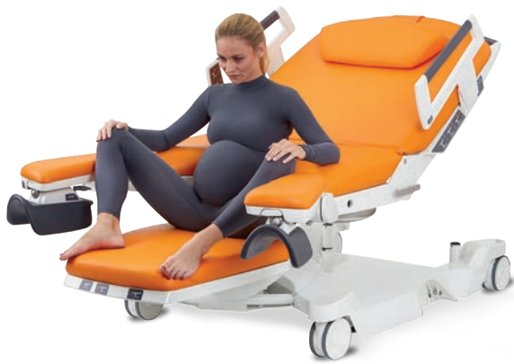
Semi-assise sur la section jambière