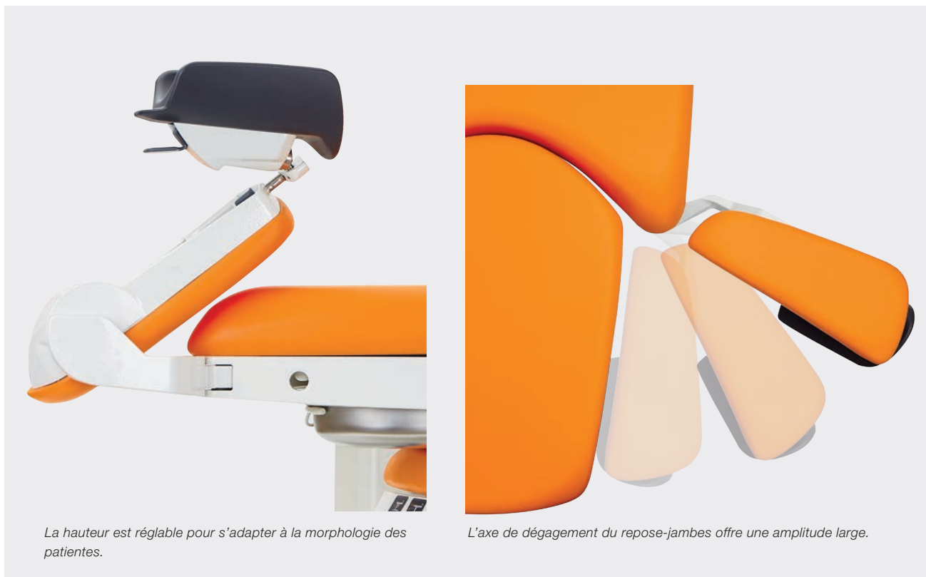
La hauteur est réglable pour s'adapter à la morphologie des patientes.