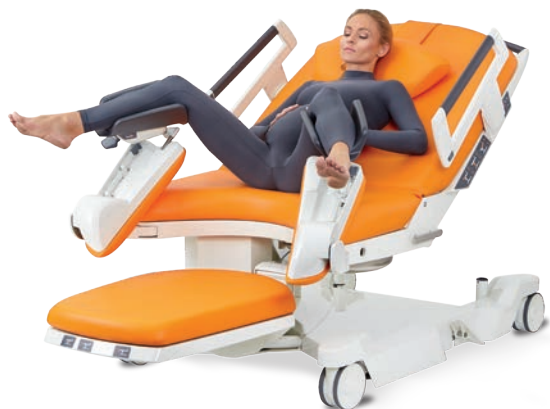
Position gynécologique passive