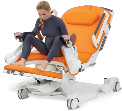
Semi-assise en appui sur les repose-jambes